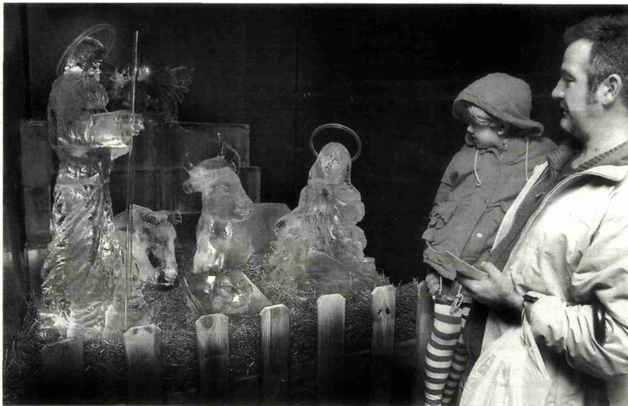
Un padre con su hija observan el Belén de Hielo instalado en el interior de un tráiler en la Alameda de Hércules.

Frente a los aparatos de ejercicios físicos, unos termómetros gigantes indican, mediante tres colores diferentes (rojo, verde y azul), el nivel de frío que se sumi-